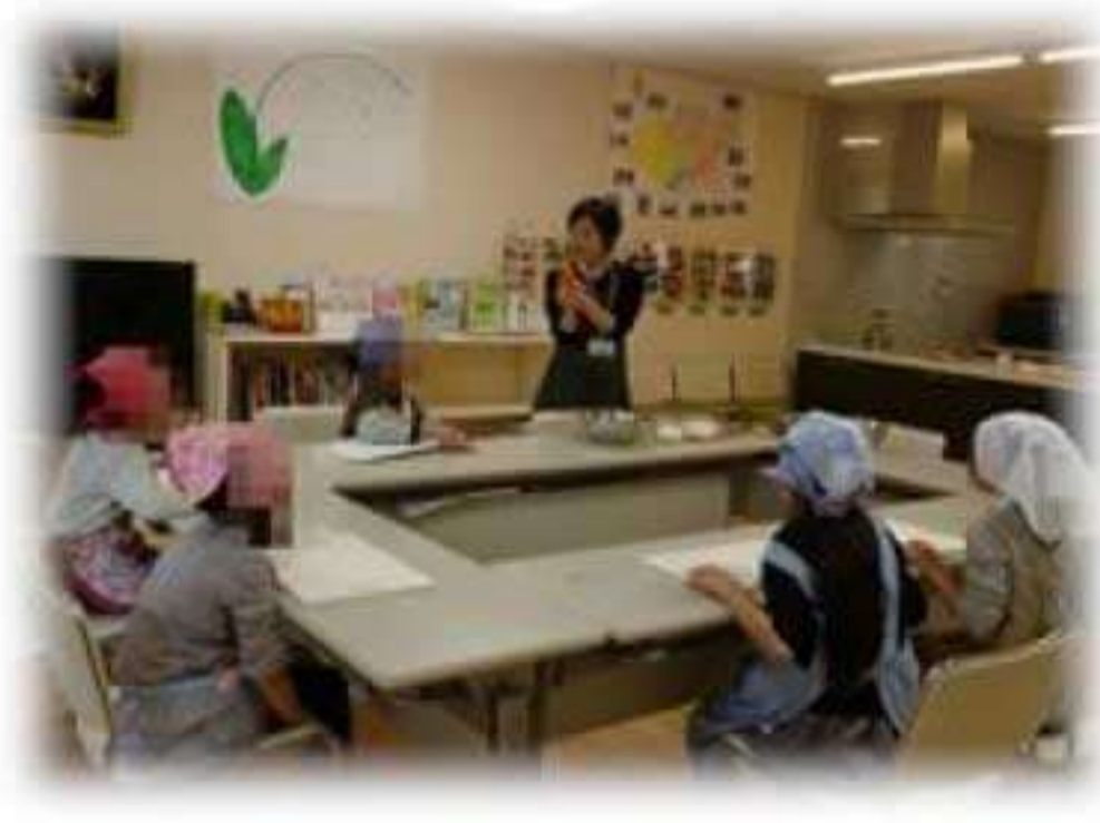
「子どもの料理教室」