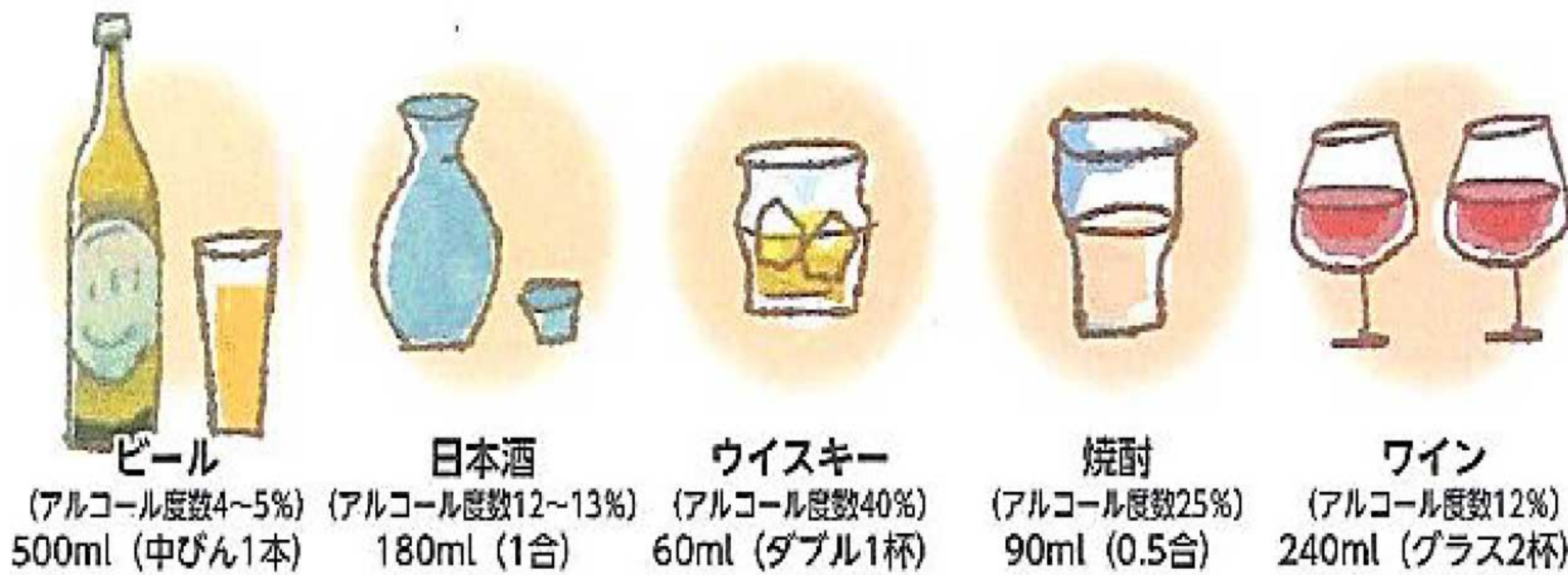
ビール (アルコール度数4~5%) 500ml (中びん1本) 日本酒 (アルコール度数12~13%) 180ml (1合) ウイスキー (アルコール度数40%) 60ml (ダブル1杯) 焼酎 (アルコール度数25%) 90ml (0.5合) ワイン (アルコール度数12%) 240ml (グラス2杯)